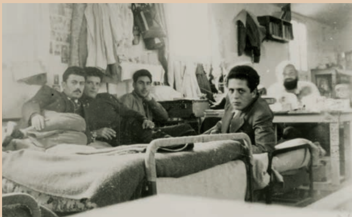
Όψη από εσωτερικό παραπήγματος όπου διέμεναν 30 Πολιτικοί Κρατούμενοι.