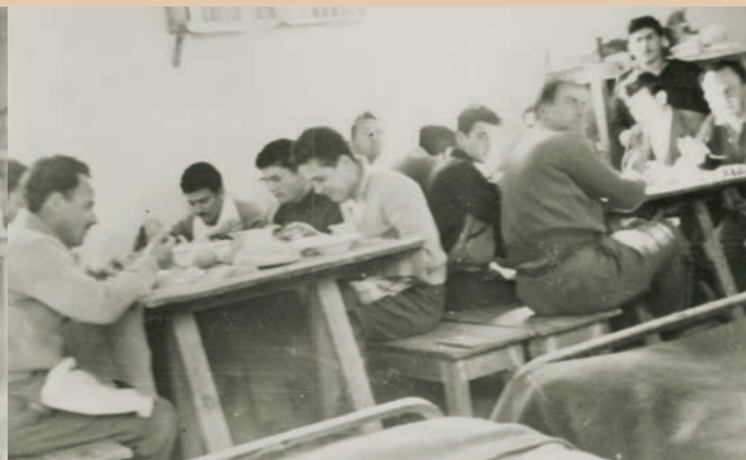
Πολιτικοί Κρατούμενοι κατά την ώρα του γεύματος στο εσωτερικό παραπήγματος.