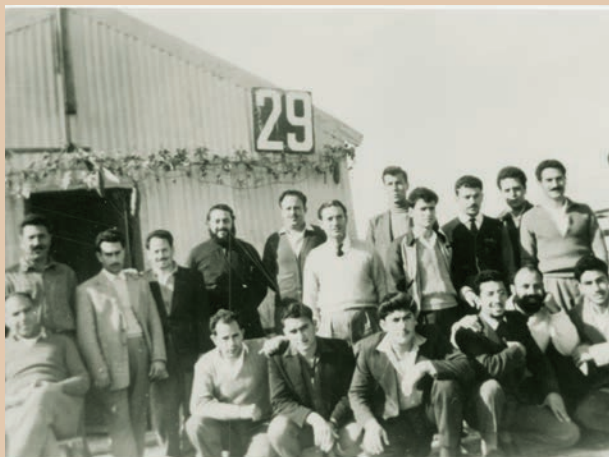
Πολιτικοί Κρατούμενοι στο διαμέρισμα Α του Στρατοπέδου Συγκέντρωσης Κοκκινότριμιθιάς.

σε 5 λεπτά οι οργανωμένοι Πολιτικοί Κρατούμενοι πυρπόλησαν τα Κρατητήρια Κοκκινότριμιθιάς. Την εξέγερση ακολούθησαν μαζικοί βασανισμοί από μονάδες του Αγγλικού στρατού που επέδραμαν στα παραπήγματα και χτυπούσαν ανελέητα τους Κρατουμένους και τους άφηναν άγρυπνους με πυροβολισμούς και λιθοβολισμούς. Τέτοιες εκδηλώσεις είχαν σαν αποτέλεσμα την άρση των προνομίων, δηλαδή την απαγόρευση αποστολής ή λήψης των πάντα λογοκριμένων επιστολών και των εβδομαδιαίων επισκέψεων. Στις περιόδους τιμωρίας, η προσπάθεια καταρράκωσης της αξιοπρέπειας των Κρατουμένων ήταν χυδαιότερη, όπως η δημόσια γύμνωση και σκληρότερη από άλλες φορές, όπως η απομόνωση στο πειθαρχείο και η ποινή επιβίωσης με ψωμί και νερό μόνο.