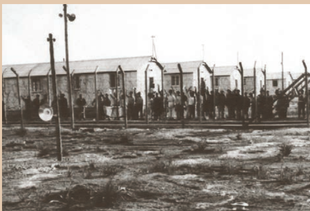
Όψη από το Στρατόπεδο Συγκέντρωσης Κοκκινοτριμιθιάς.

Κατά την τετραετία του απελευθερωτικού αγώνα της ΕΟΚΑ, τα Στρατόπεδα Συγκέντρωσης ήταν τα πεδία της διαρκούς και άνισης ηθικής αντίστασης και αναμέτρησης της ψυχής του αγώνα με τον κατακτητή. Η ψυχή του Κυπριακού Ελληνισμού υπερίσχυσε όμως κατά κράτος του αντιπάλου. Οι Πολιτικοί Κρατούμενοι νίκησαν. Και ο Διγενής τους χαρακτήρισε ως «το άνθος της Κυπριακής νεότητας και το ίνδαλμα της Κύπρου».