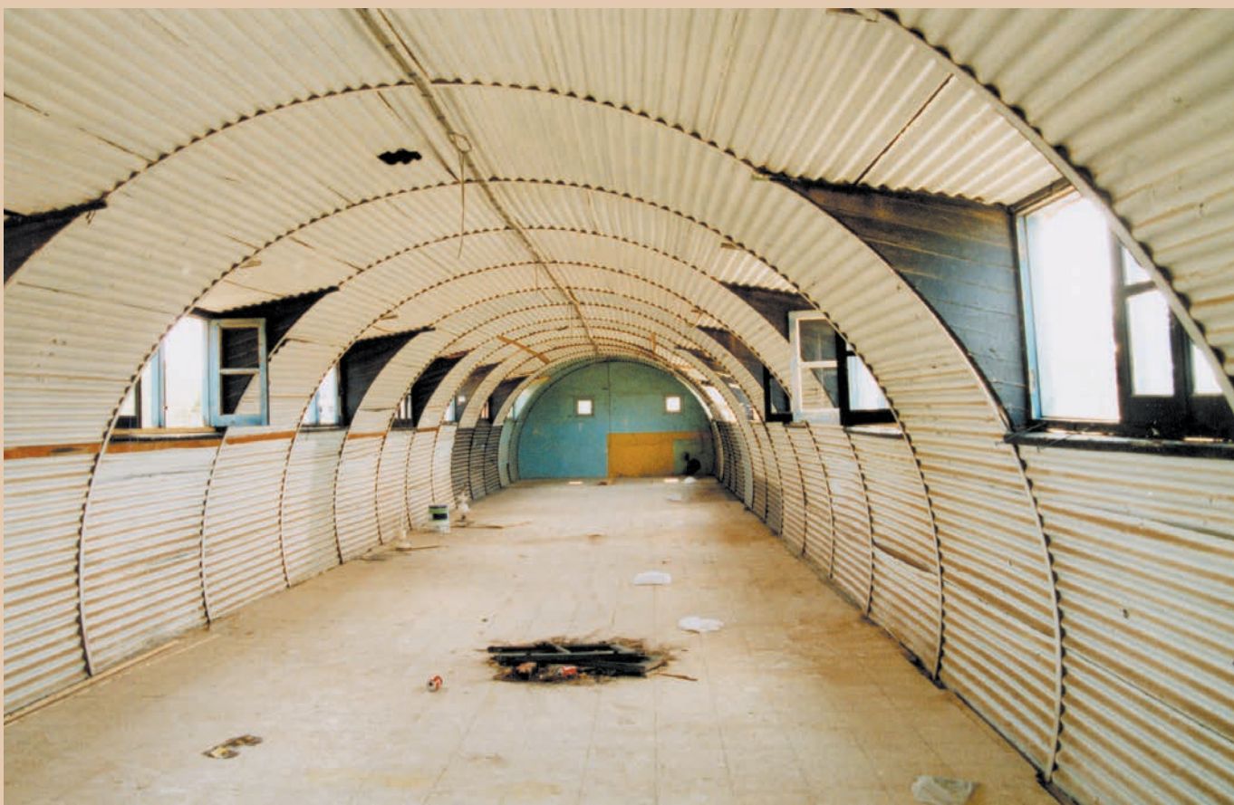
Παράπηγμα των Κρατητηρίων Κοκκινότριμιθιάς όπως είναι σήμερα.