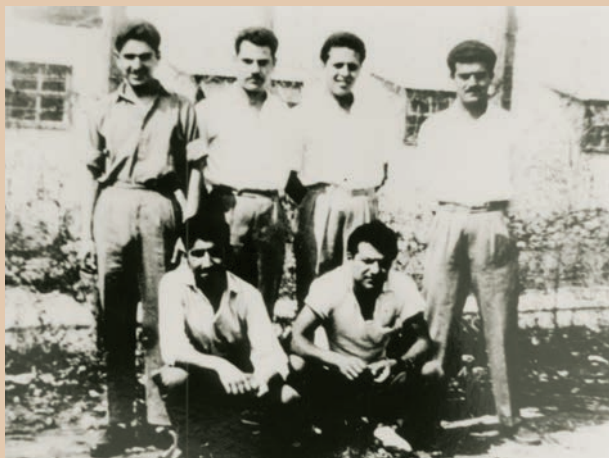
Μαθητές αγωνιστές της ΕΟΚΑ στο Στρατόπεδο Συγκέντρωσης Κοκκινότριμιθιάς.

νεκρές ζώνες όπου κινούνταν μόνο οι φρουροί και ανιχνευτικά λυκόσκυλα. Οι Κρατούμενοι μπορούσαν να διαβάζουν, να αθλούνται με πρωτόγονα μέσα, να ασχολούνται με τη λεπτουργική και να αντλούν ψυχική δύναμη με τη συμμετοχή τους στη μελέτη της Αγίας Γραφής.